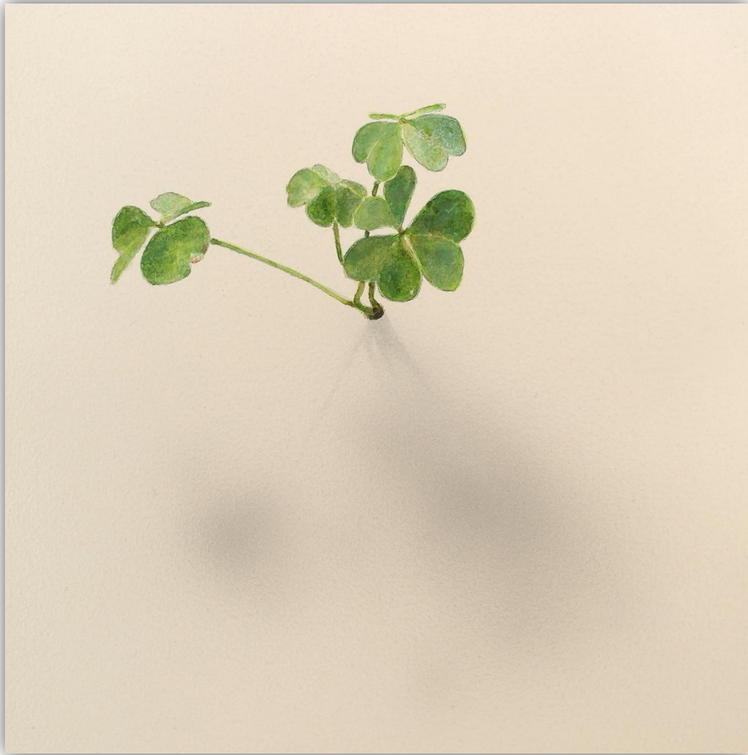
El susurro de las hojas N-1903 Acrílico/Lienzo 20 x 20