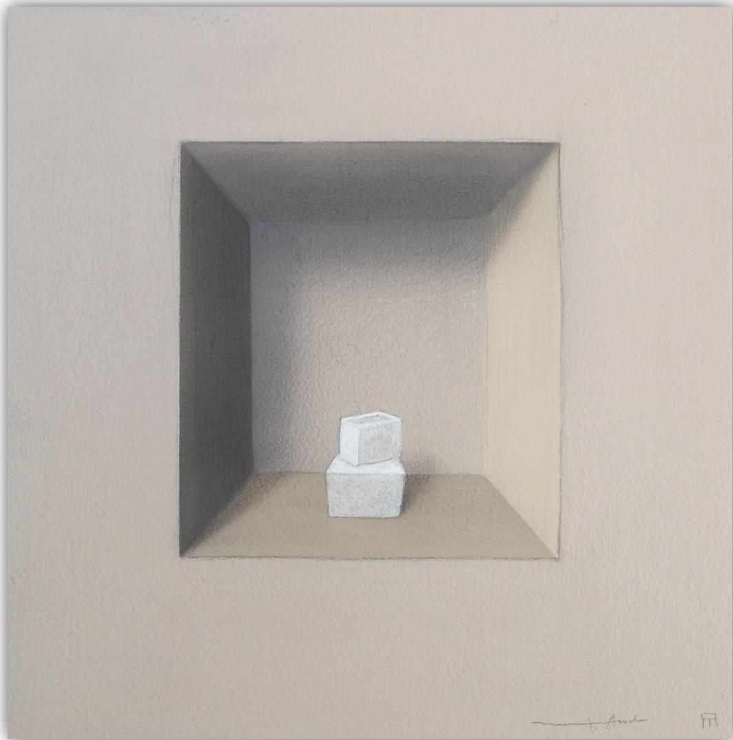
Viceversa 1802 Acrílico/Lienzo 20 x 20