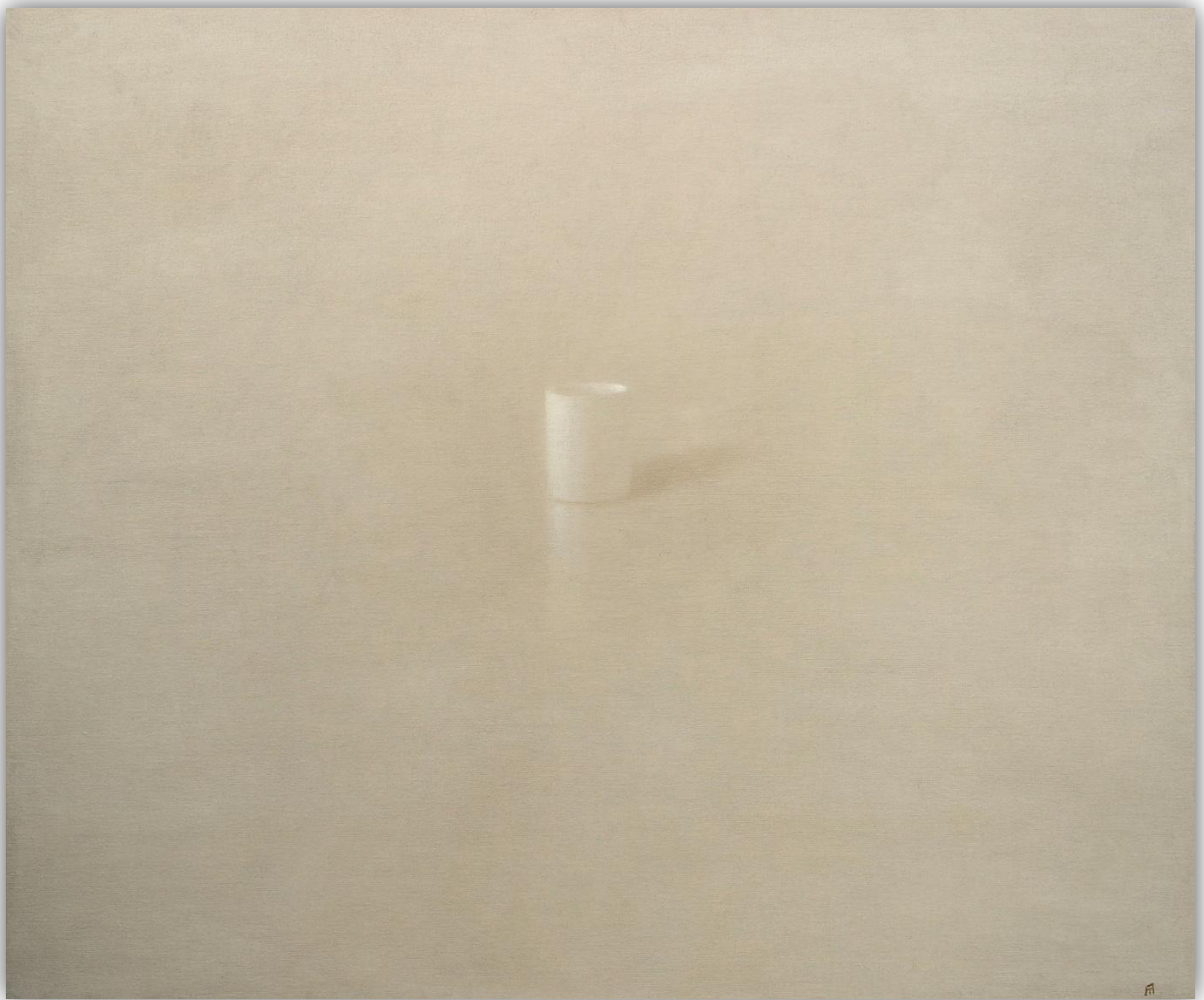
Metáfora -1201 Acrílico/Lienzo - 50 x 61