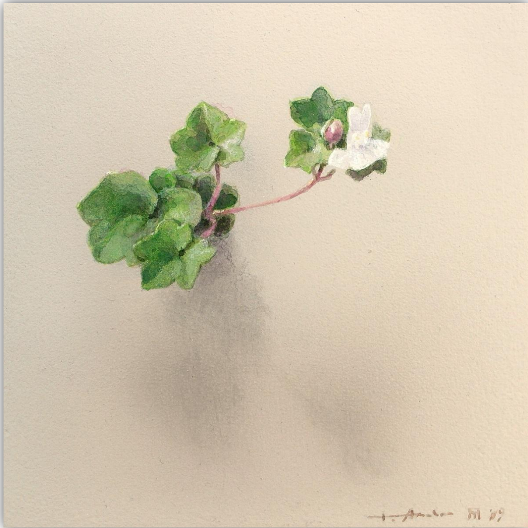
El susurro de las hojas N-1904 Acrílico/Lienzo 20 x 20