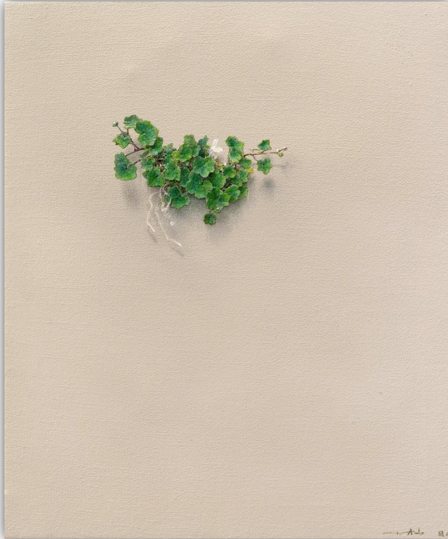
El susurro de las hojas N-1810 Acrílico/Lienzo 55 x 46