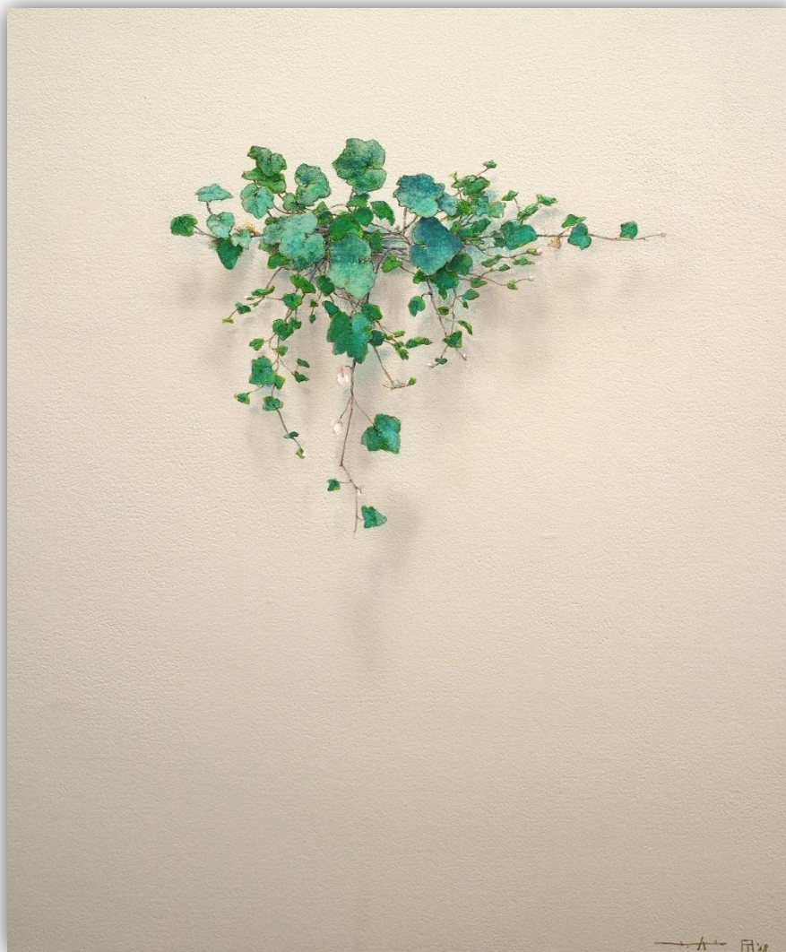
El susurro de las hojas N-1814 Acrílico/Lienzo 55 x 46