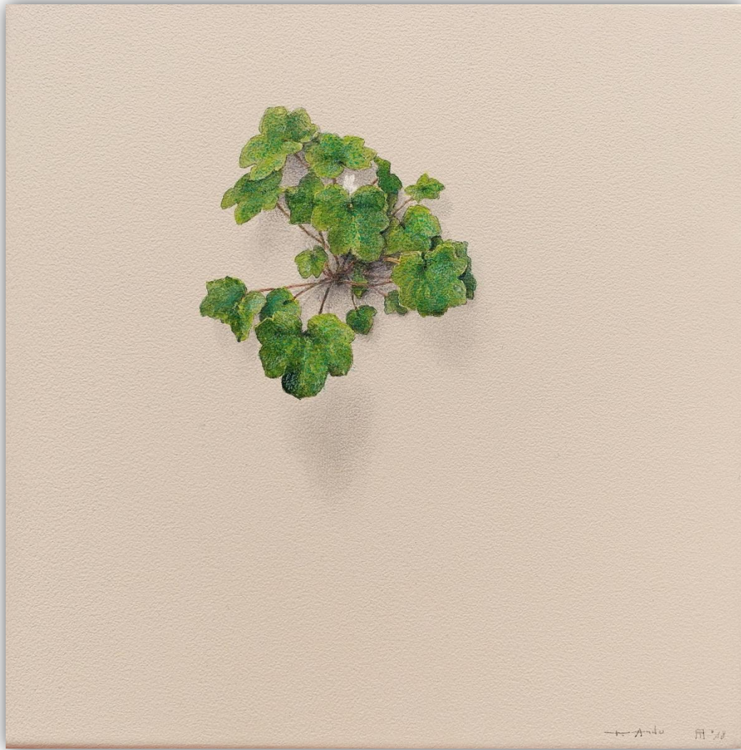
El susurro de las hojas N-1801 Acrílico/Lienzo 30 x 30