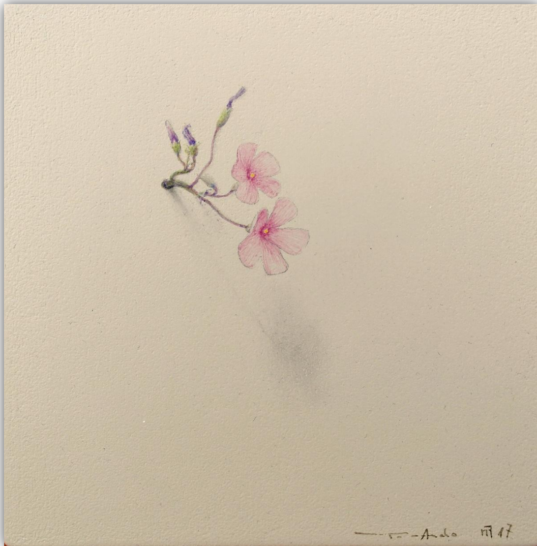
El susurro de las hojas N-1803 Acrílico/Lienzo 20 x 20