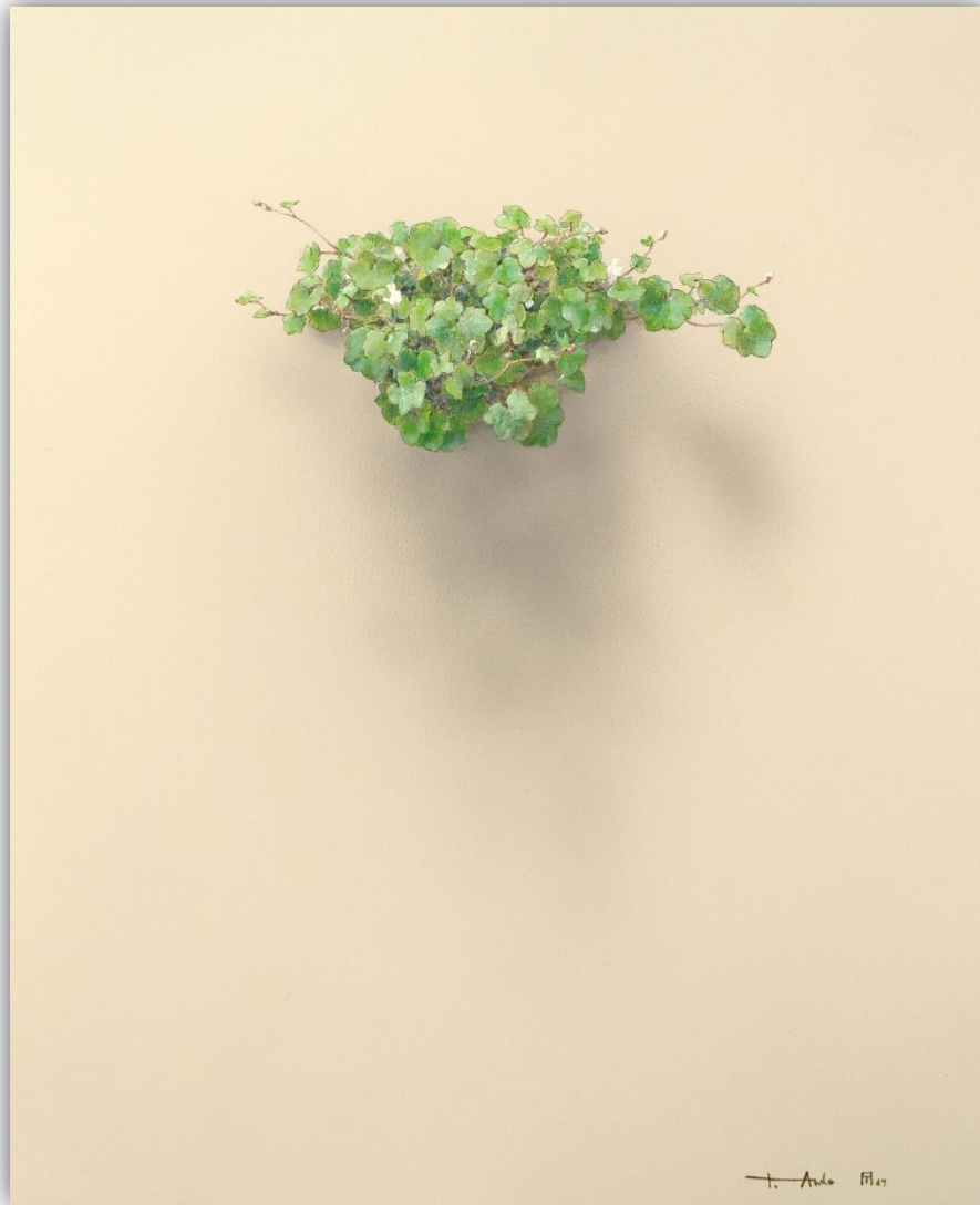
El susurro de las hojas N-1902 Acrílico/Lienzo 61 x 50