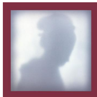
Lágrima 4 : Memorias S04-3 (Nambaya Okita, 1798 – Kitagawa Utamaro)