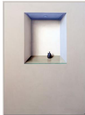
Lágrima 3 “Viceversa” : Viceversa IX-13