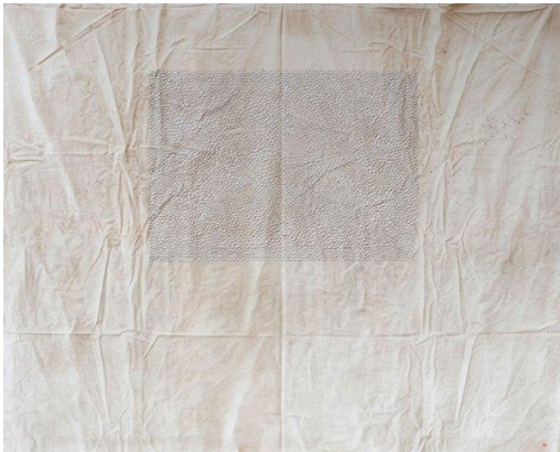
Lágrima 1 “Arrugas” : Lágrimas XII-01 (Colección Diputación de Alicante)

En su exposición “Cuatro Lágrimas” que tuvo lugar en el Centro Cultural San Marcos de Toledo en julio de 2013 (como parte de los eventos del Año Dual España y Japón para conmemorar 400 años de relaciones), expuso sus obras clasificadas en cuatro lágrimas; Lágrima 1 “Arrugas”, Lágrima 2 “Viceversa”, Lágrima 3 “Sísifo”, Lágrima 4 “Memorias”, series que Ando produjo en cuatro períodos diferentes de su vida.