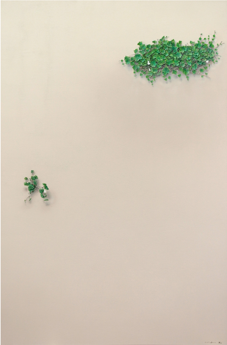
El susurro de las hojas nº1704. Acrílico / lienzo. 146x97 cm.