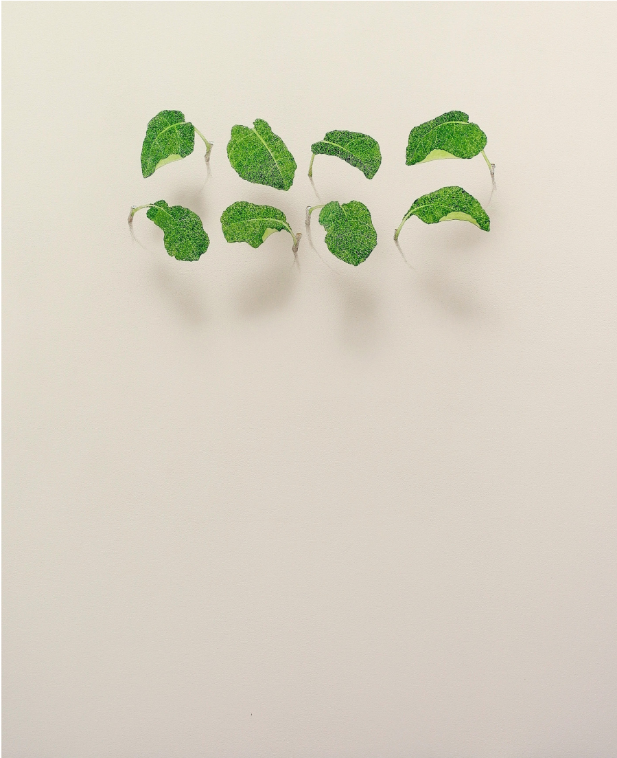
Ocho filósofos. Acrílico / lienzo. 100x81 cm.