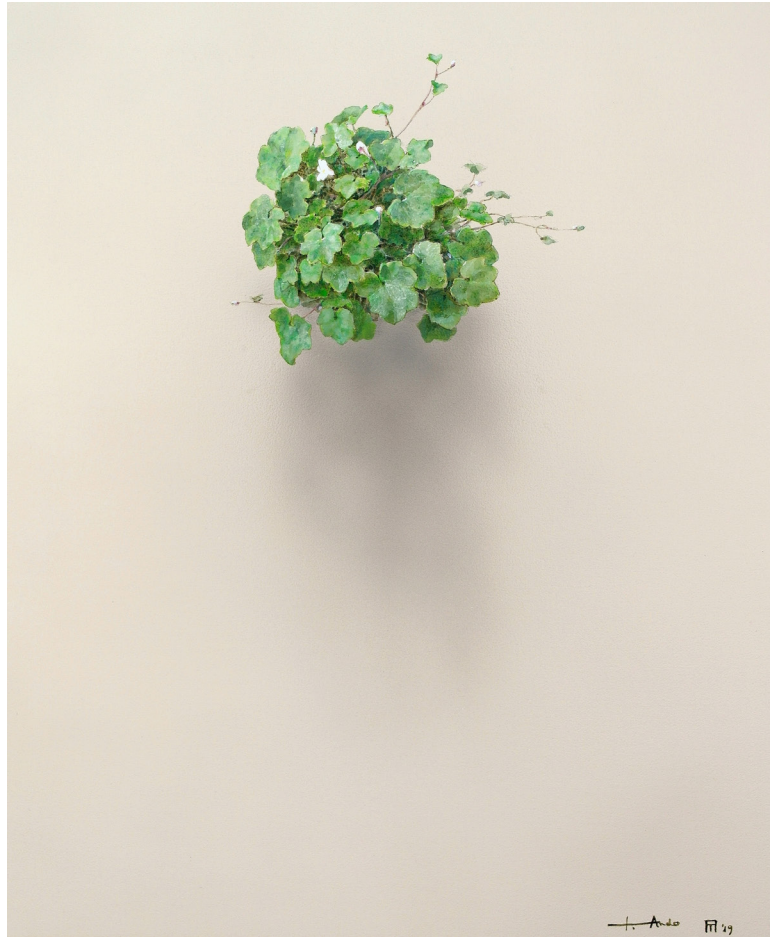
El susurro de las hojas N°2002. Acrílico / lienzo, 55x46 cm.