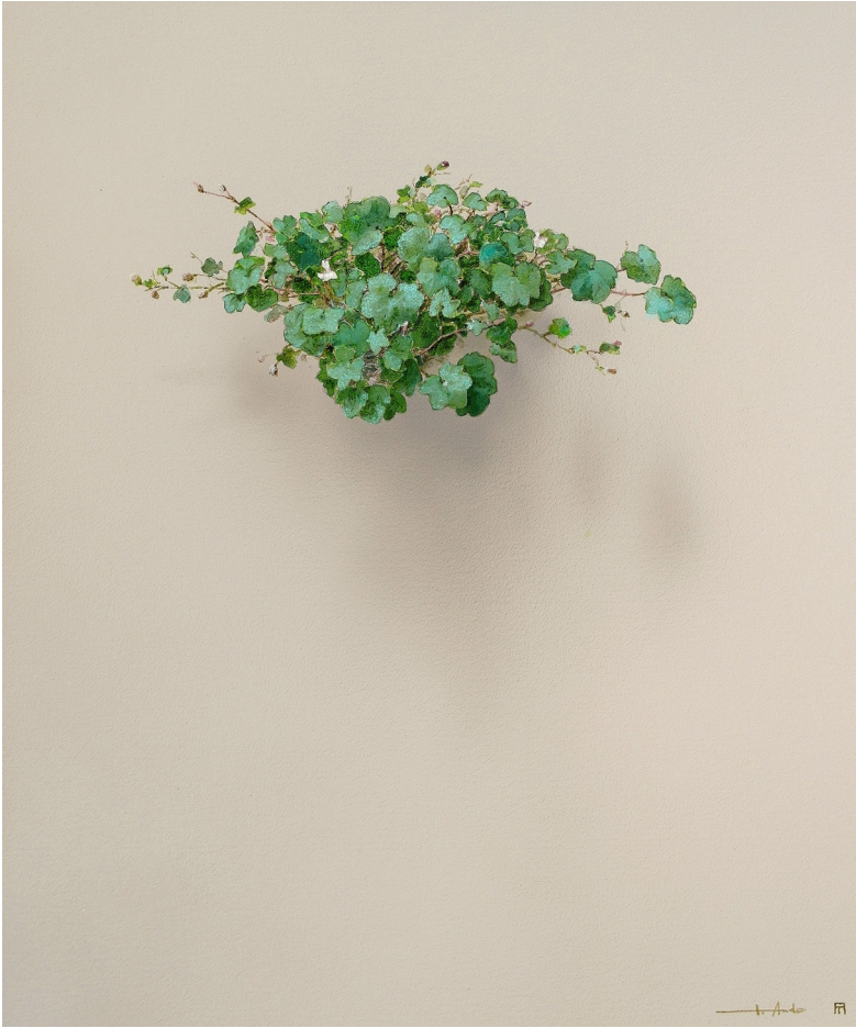
El susurro de las hojas n°2004. Acrílico / lienzo. 55x46 cm.