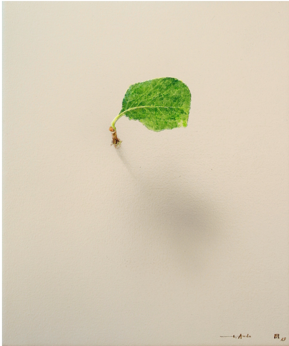
El susurro de las hojas N°1905. Acrílico / lienzo. 30x25 cm.