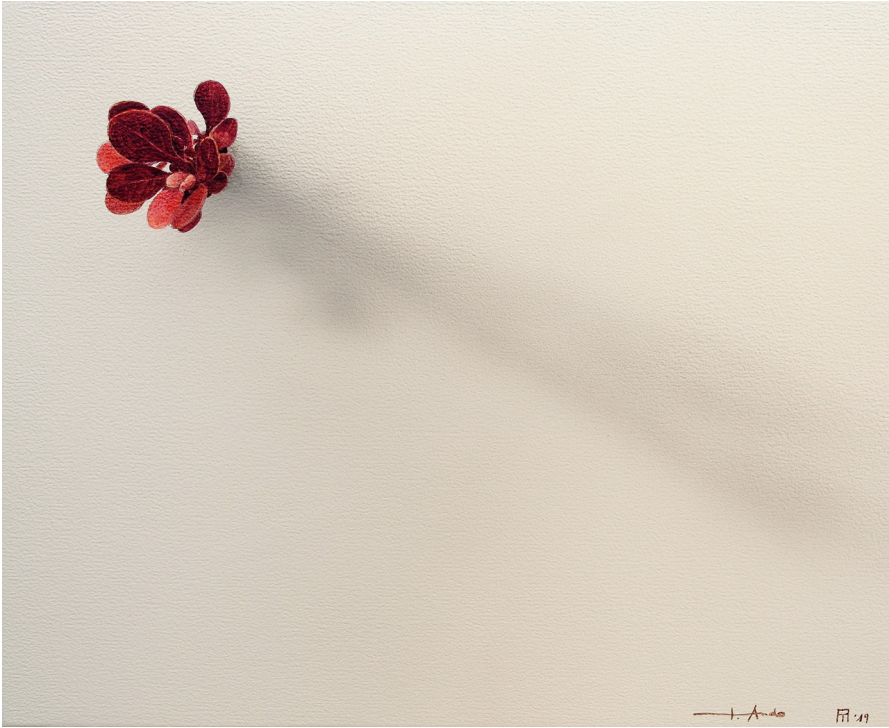
El susurro de las hojas N°2005. Acrílico / lienzo. 33x41 cm.