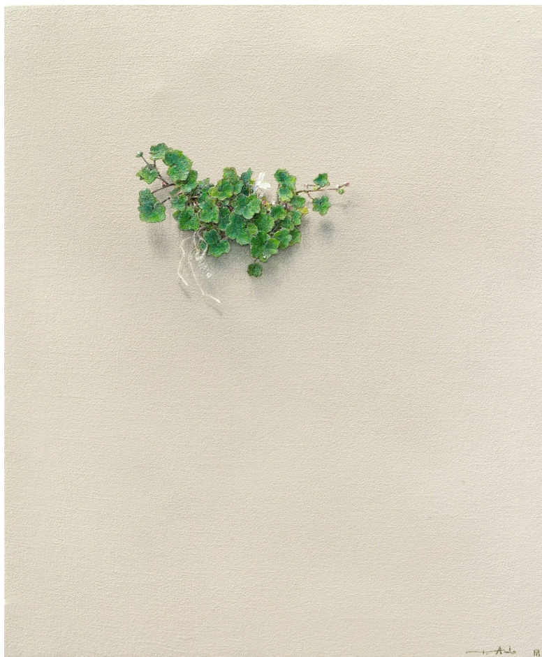
El susurro de las hojas N°2003. Acrílico / lienzo, 55x46 cm.