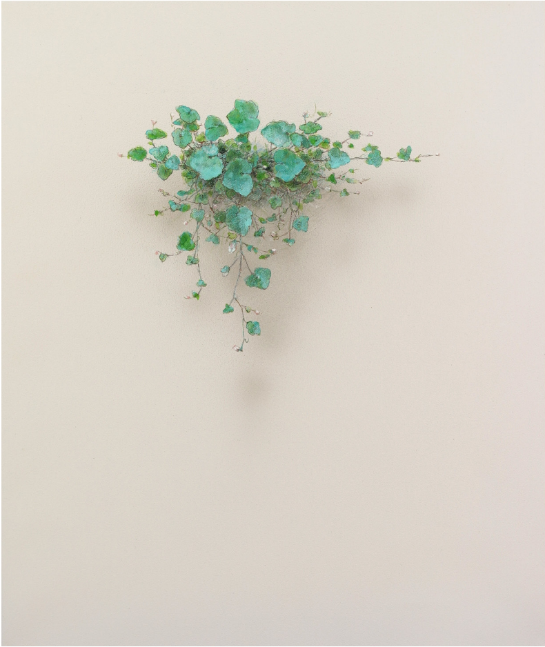
El susurro de las hojas N°2001. Acrílico / lienzo. 55x46 cm.